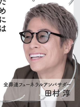
全葬連フューネラルアンバサダー 田村 淳